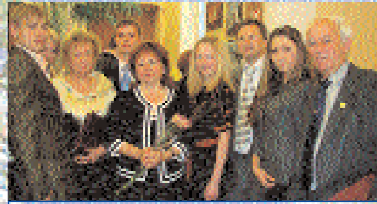
Студенти КУП НАН України з Уповноваженим Верховної Ради України з прав людини П.Карпачовою