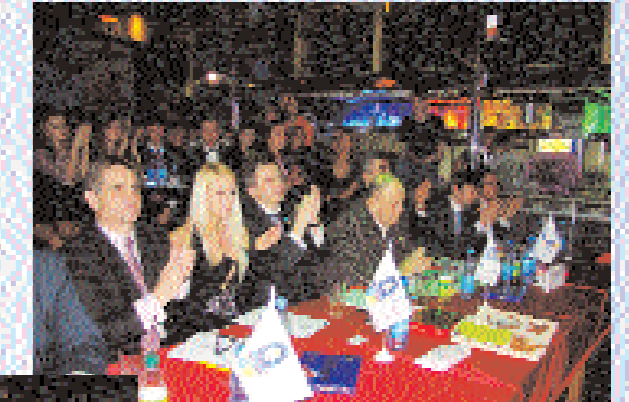
Почесне журі конкурсу