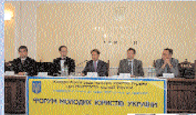
Відкриття форуму відбулося в Міністерстві юстиції