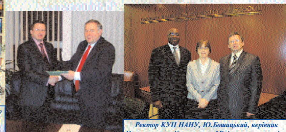
Під час підписання угоди з Мішкольським університетом