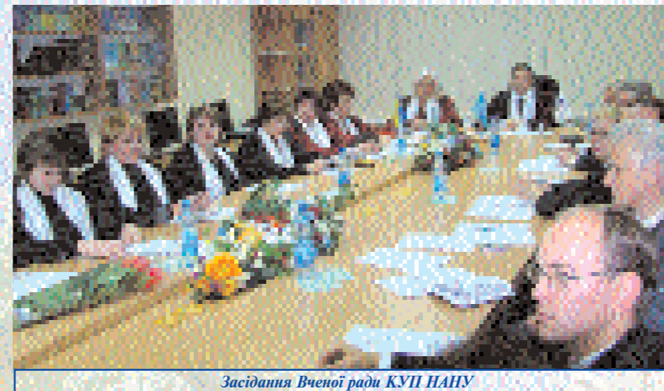
Засідання Вченої ради КУП НАНУ