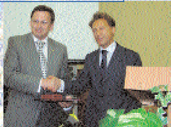
Вручення нагороди ректору університету Міністром юстиції України М.Огішукюком