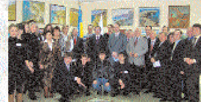
Презентація виставки живопису в рамках проекту КУП НАНУ «Перлини сучасного живопису для студентської молоді»