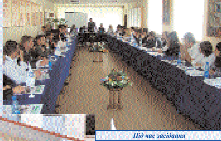
Під час засідання