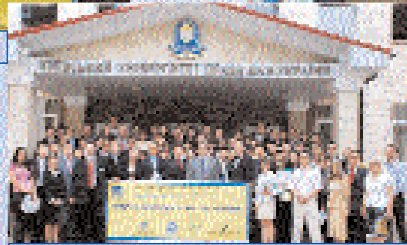
Фото на згадку учасників форуму в КУП НАНУ