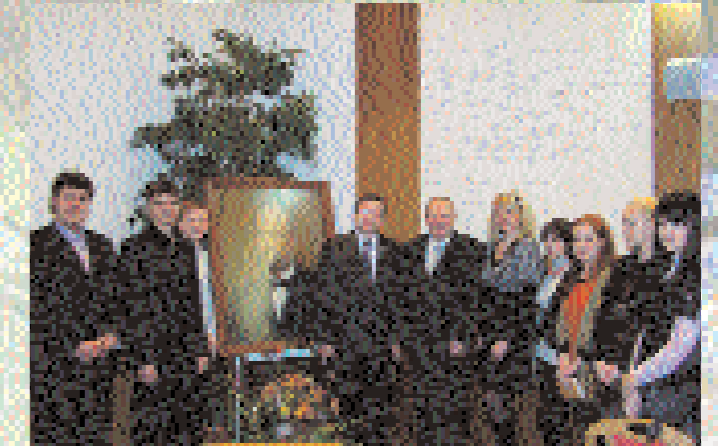
Студенти КУП НАНУ з Академіком-секретарем Відділення історії філософії та права НАНУ академіком О.Опишемком на конференції