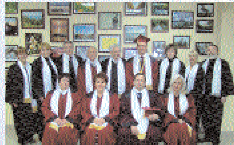
Професорсько-викладацький склад КУП НАНУ