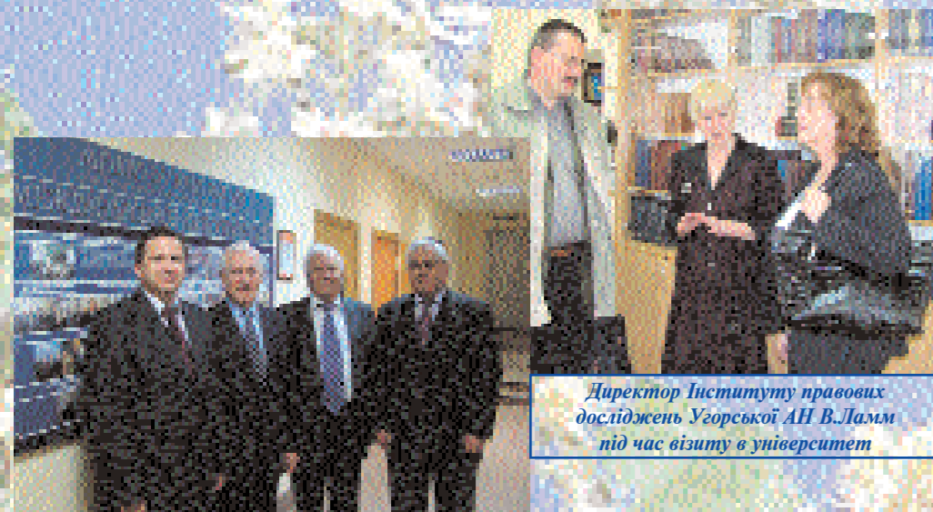
Делегація КУП НАНУ під час відвідування відділу Міжнародної співпраці МІГМО