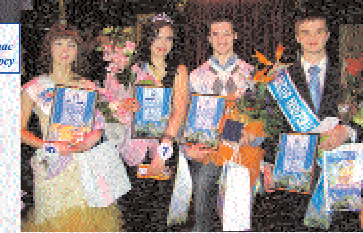
Переможці конкурсу «Міс та Містер університет — 2009»