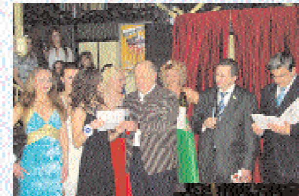
Голова Союзу юристів України В.Євдокимов вручає нагороди учасникам конкурсу